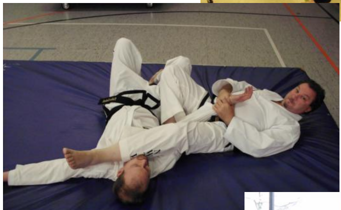
Jubiläumslehrgang in Hemmerde 20 Jahre Se-Jong e.V.

Turnier in Boffzen: Se-Jong Sportler auf dem Siegereppchen!