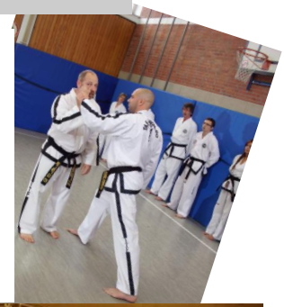
Jugendtrainingscamp in Wipperfürth