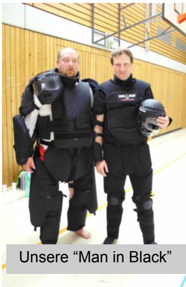
Unsere "Man in Black"