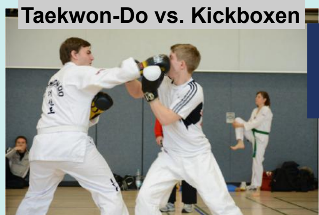
Taekwon-Do vs. Kickboxen

TUL und Technik Seminar mit Meister Horan (7.Dan) aus England in Witten für unsere Schwarzgurte