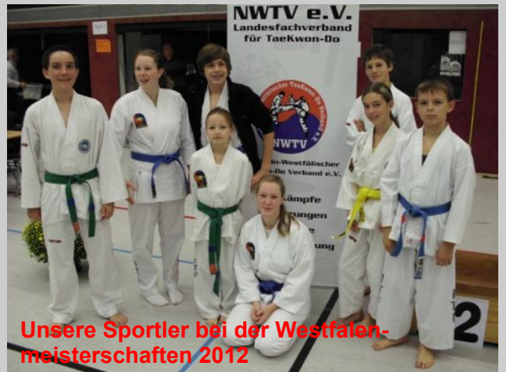
Unsere Sportler bei der Westfalenmeisterschaften 2012