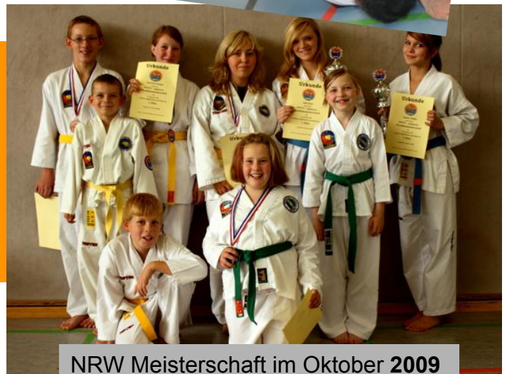
NRW Meisterschaft im Oktober 2009