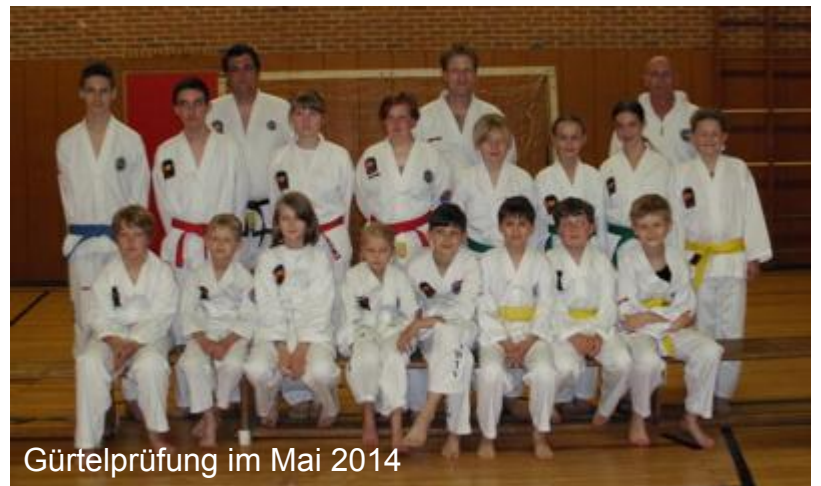
Gürtelprüfung im Mai 2014