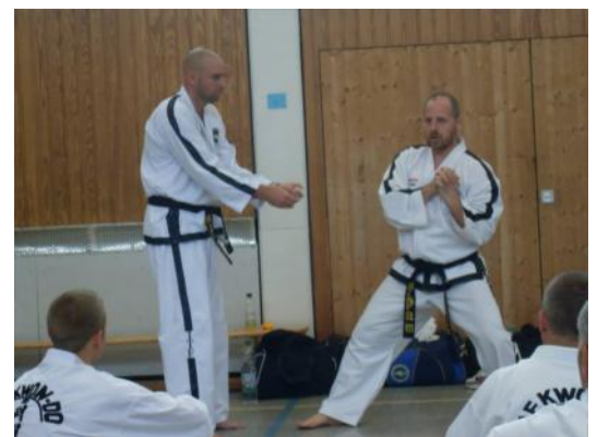
Bild 3+4: Meister Horan demonstriert eine Befreiungstechnik ( engl: Release )